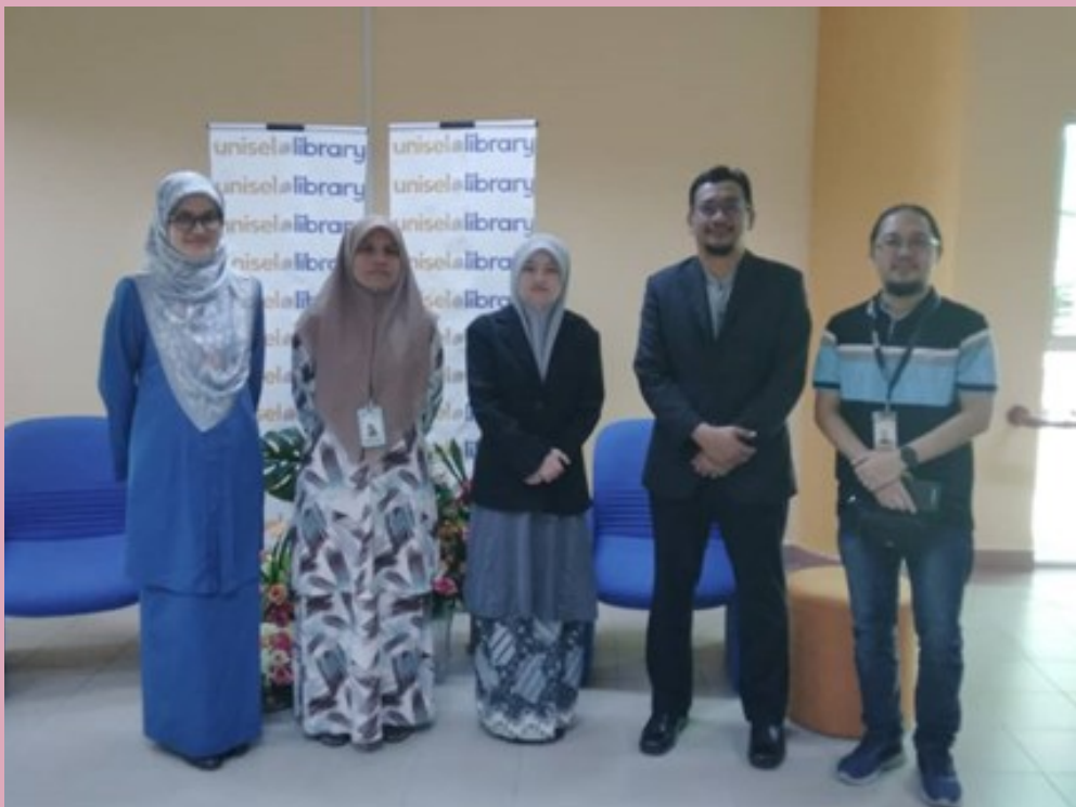
20 JUN 2023 | Lawatan panel MQA bagi Program Asas Sastera.