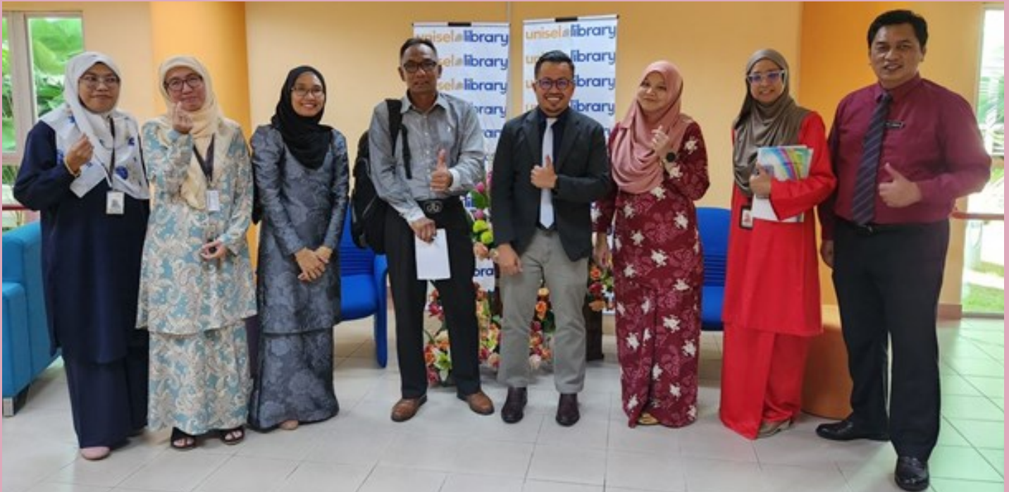
19 JUN 2023 | Lawatan panel MQA bagi Program Sarjana Pendidikan