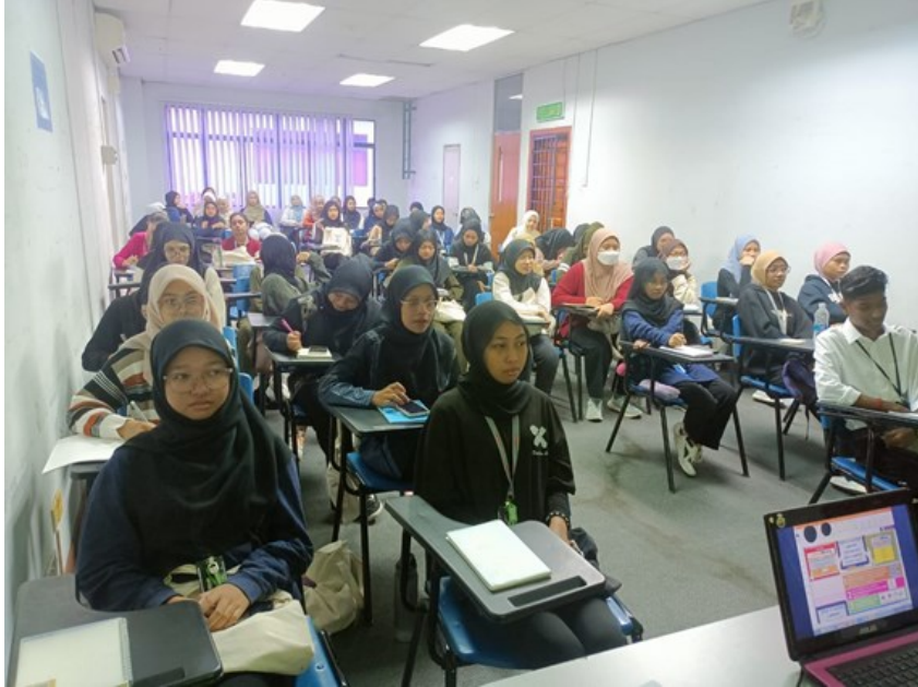
06 SEPTEMBER 2023 | Program Literasi Maklumat, Introduction to UNISEL Library dan Online database & Free Access Collection for Literature. Dihadiri oleh 55 orang pelajar dari program Diploma in Nursing, Fakulti Sains Kesihatan.