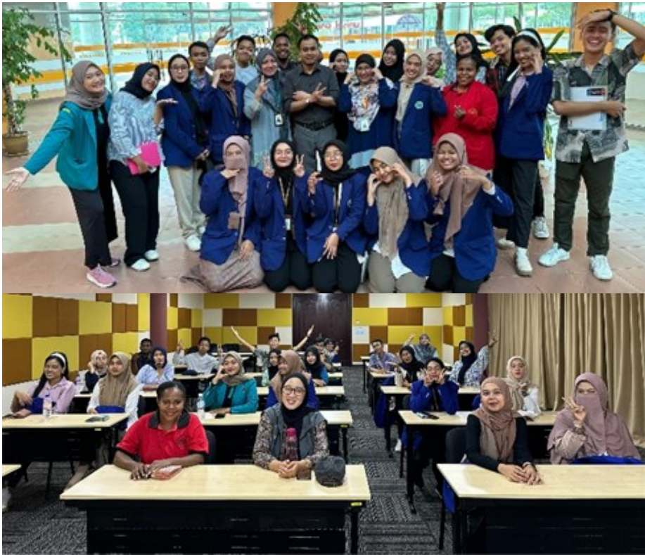
29 SEPTEMBER 2023 | Sesi Slot 1 Introduction to UNISEL Library @ Library Tour bagi pelajar-pelajar Program Mobiliti Antarabangsa dari Indonesia seramai 21 orang.